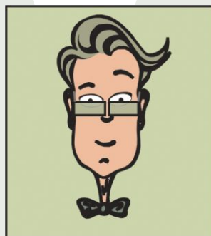
Ayudante del sistema

El ayudante del sistema, que se activa cuando el usuario está sobre su sector, permite encontrar cualquier tipo de información sobre el funcionamiento del sistema.